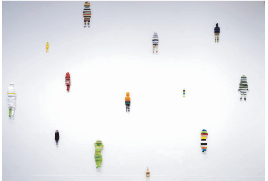
Families (部分) 2007 アクリル板 資生堂アートハウス展、個人展