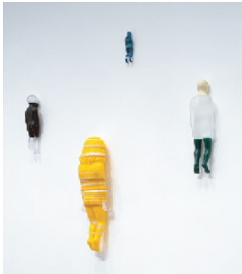
左から Son-2 Daughter-7(Dance) Mother-1 Father-6 Families(部分)

《Families》は、作家の家族(父、母、娘、息子)をモデルにした作品です。今回は、6グループ24体に、父と息子が抱き合った床置き作品1体を加えた全25体を出品。