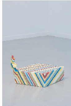
ビルの煙 2007 アクリル板