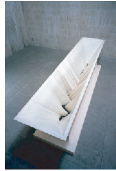
奈落の水 2004 繊維強化プラスチック、木、塗料

袴田は、アクリル以外にも、さまざまな素材を用いて彫刻を作り続けてきました。ベニヤ板や金属板、FRP(繊維強化プラスチック)、電気、コード、家具といった、どれも彫刻の素材らしからぬもの。一見全く違って見える作品に通底する、作家の世界に迫ります。