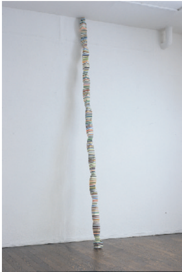
立ち上る煙 2006 アクリル板

袴田の作品は、アクリル板を積み重ねて、そこから形を作り出しています。しっかりとした形でありながらも、色の積み重ねにより、形は見えにくくなり、不思議な軽やかさを生み出しています。