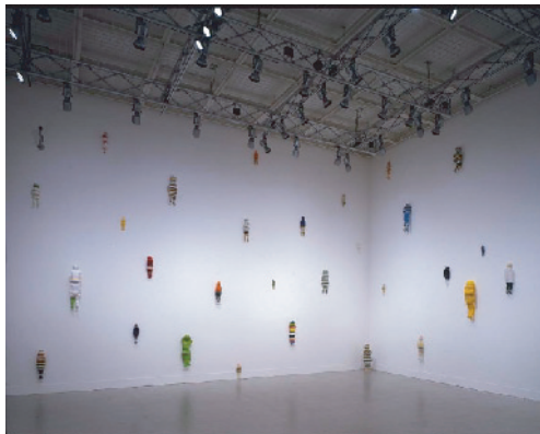
Families 2007 アクリル板 資生堂アートハウス蔵、個人蔵