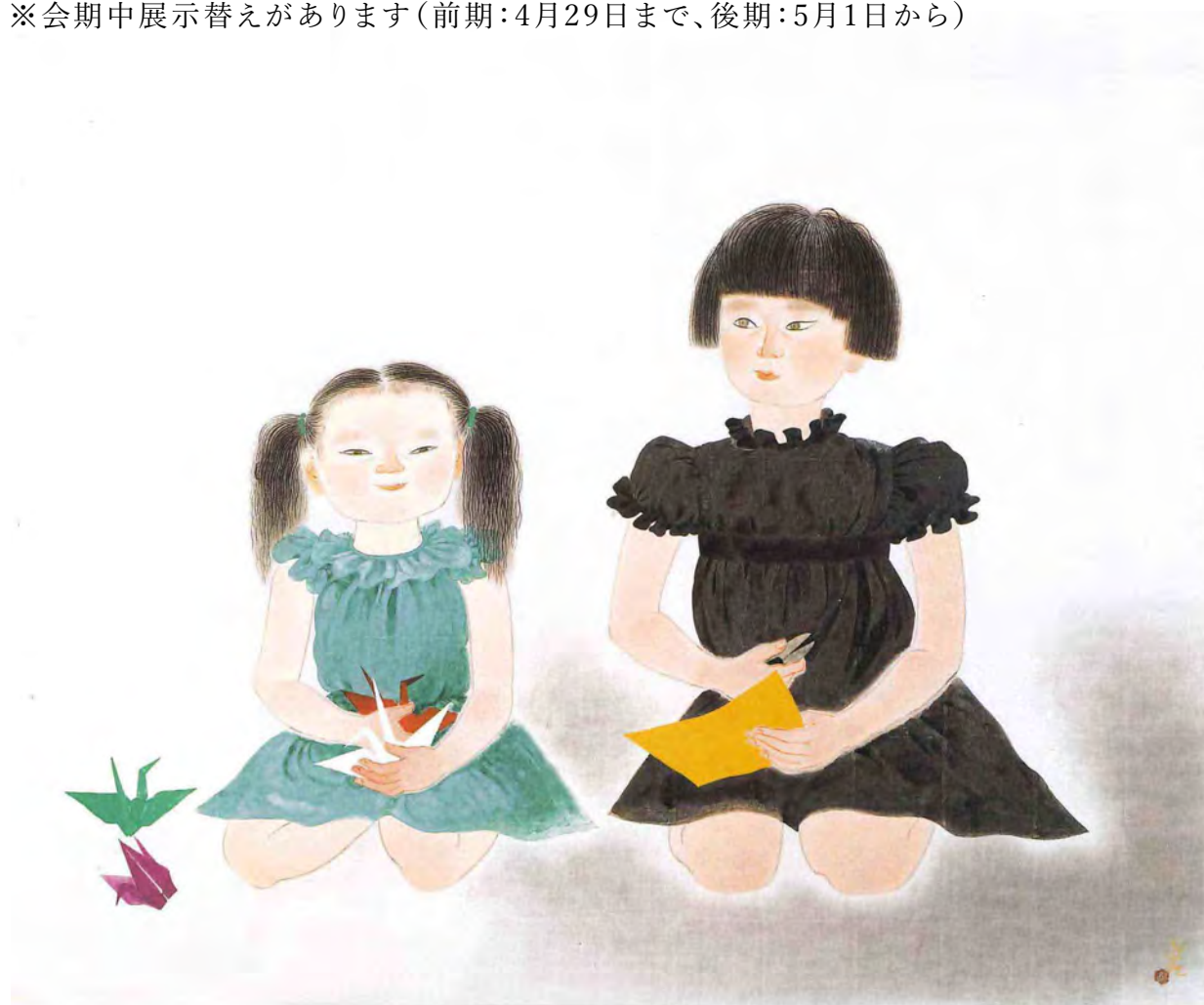
小倉遊亀《姉妹》昭和45年(1970) [後期]