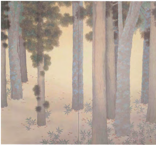
菱田春草《落葉》 明治42年(1909) 後期