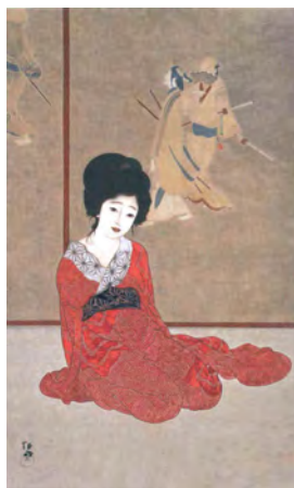
北野恒富《暖か》 大正4年(1915) 第9回文展 後期