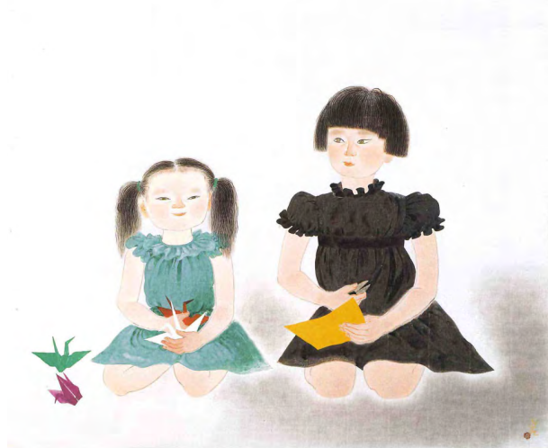
小倉遊亀《姉妹》昭和45年(1970)再興第55回院展 後期

戦後の若い女性の「燃えるような希望に輝く眼」「きかぬ気な張り切ったものごし」を捉えた作品。この時期の遊亀の単純化された造形には、マティスやピカソらの20世紀美術の影響が指摘されている。