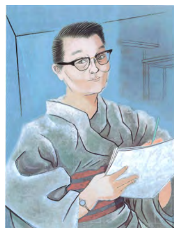
小倉遊亀《画人像》 昭和37年(1962) 再興第47回院展 後期

本展は、小倉遊亀と日本美術院の画家たちを収集方針に掲げ活動してきた滋賀県立近代美術館の全面協力を得て、同館が所蔵する名品により、小倉遊亀の芸術の精華とそれを育んだ日本美術院の俊英たちの活躍をたどります。