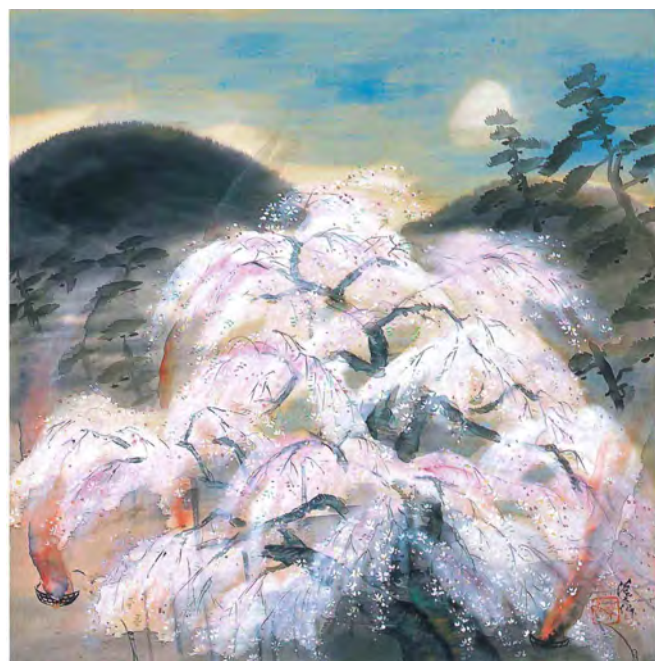
富田溪仙《祇園夜桜図》