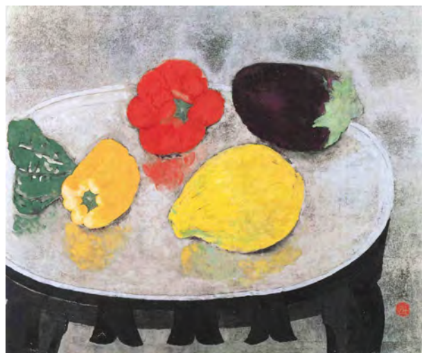
小倉遊亀《紅白紫黄》平成元年(1989)再興第74回院展 通期

紅白の折鶴を手にして満足そうな妹、黄色の折紙とはさみを手に虚空を見つめ何事かに集中する姉、それぞれの表情が描かれる。色数を抑えた中、鮮やかな折紙がアクセントになっている。背景の絶妙なトーンは箔の上に絵具を幾度も塗り重ねて表されたもの。