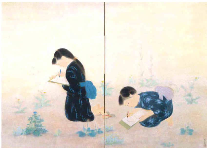
小倉遊亀《初夏》昭和3年(1928)再興第15回院展 前期

初夏の野で熱心に写生をする子どもたち。その真剣なまなざしは画家自身の姿とどこか重なる。細かな筆致による写実的表現は昭和初期頃までの作風の特徴。