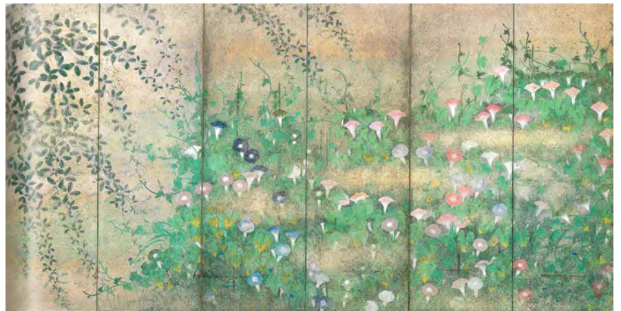
小茂田青樹《四季草花図 夏》大正8年(1919) 前期

御舟の京都時代の代表作。群青と緑青の色合いの微妙な違いによって奥行きと立体感を表している。細かな筆遣いがこの後の細密描写の時代を予感させる。