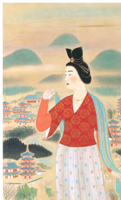
安田鞞彦《飛鳥の春の額田王》