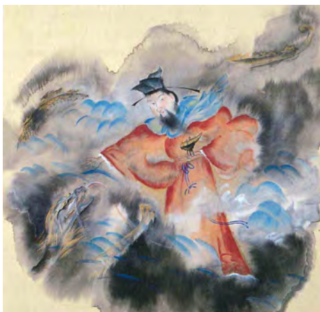
らしんじん 富田溪仙《羅真人》(《列仙》のうち) 大正9年(1920) 再興第7回院展 前期