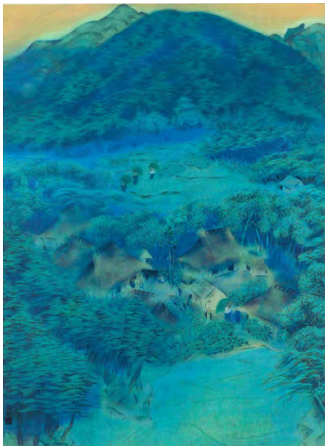
速水御舟 らくほくしゅうがくいんむら 《洛北修学院村》