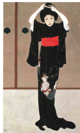
北野恒富《鏡の前》 大正4年(1915) 再興第2回院展 後期