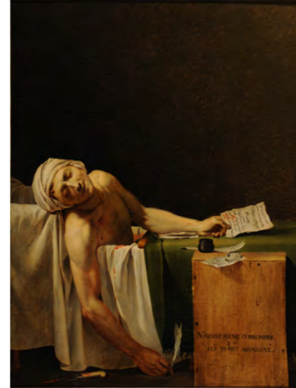
ジャック＝ルイ・ダヴィッド(および工房) 《マラーの死》1793年7月13日以降