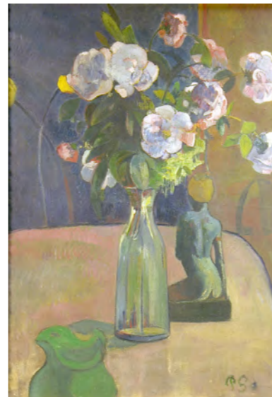
ポール・ゴーギャン 《バラと彫像》 1889年