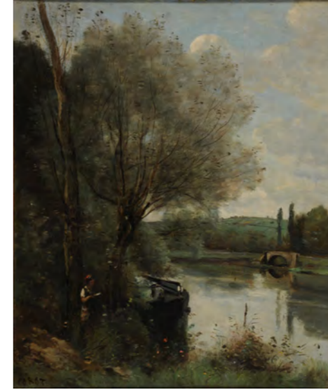
カミュ＝コロロー 《川辺の木陰で読む女》1865年から1870年の間