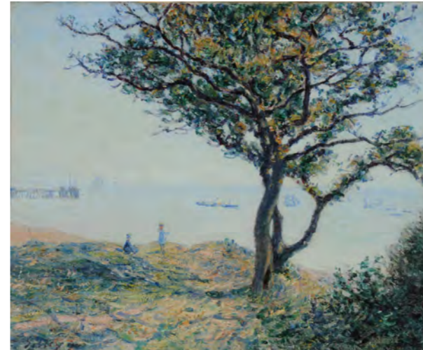
アルフレッド・シスレー 《カーディフの停泊地》 1897年