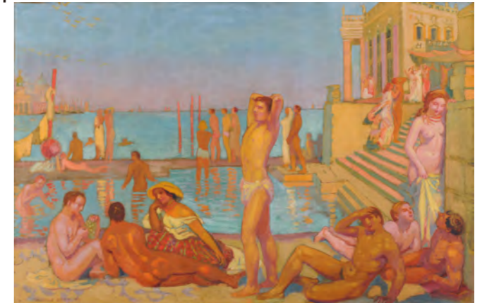
モーリス・ドニ 《魅せられた人々》 1907年

作品はすべて ランス美術館 蔵 Reims, Musée des Beaux-Arts