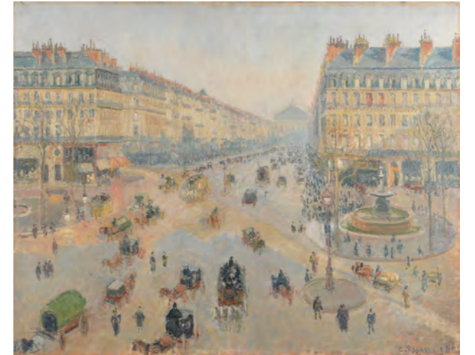
カミュ＝ピサロ 《オペラ座通り、テアトル・フランセ広場》 1898年