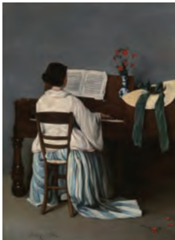
フランツワ・ボンヴァン《スピネットを弾く女性》 1862年 油彩・カンヴァス

少年のころからビジネスの世界に身を置いたバレルにとって、室内の情景や静物画に描かれた静寂な空間は、心を癒す場所であったでしょう。英国で人気のあったファンタン＝ラトゥールの花の作品をはじめ、親密な雰囲気漂う室内が描かれた作品を紹介します。