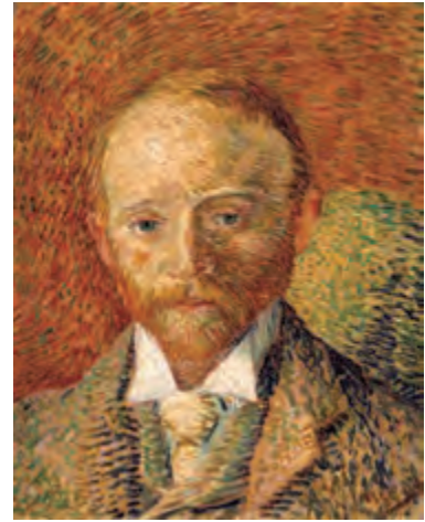
フィンセント・ファン・ゴッホ《アレクサンダー・リードの肖像》1887年 油彩・板 ケルヴィングローヴ美術博物館蔵

バレエのリハーサルに励むダンサーたちを、離れた所から覗き見るような、ひっそりとした雰囲気が漂う本作。しかし、手前のフロアの空間は大きく取られ、左側の螺旋階段の上からダンサーが降りてくるなど、その構図は大胆です。バレレ・コレクションのなかでも特に大事にされてきた、ドガの知られざる名作をお見逃しなく。