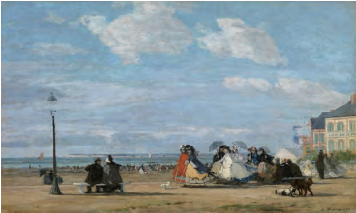
ウジェーヌ・ブーダン 《トゥルーヴィルの海岸の皇后ウジェニー》 1863年 油彩・板