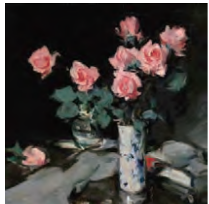
サミュエル・ジョン・ペブロー《バラ》1900-05年頃 油彩・カンヴァス ©CSG CIC Glasgow Museums Collection

本展では、ゴッホによる肖像画のほか、バレレと同時代にグラスゴーの海運業で財をなしたウィリアム・マキネスが集めたシスレー、ルノワール、セザンヌらの作品が、ケルヴィングローヴ美術博物館から出品。7点のうち3点が日本初公開です。