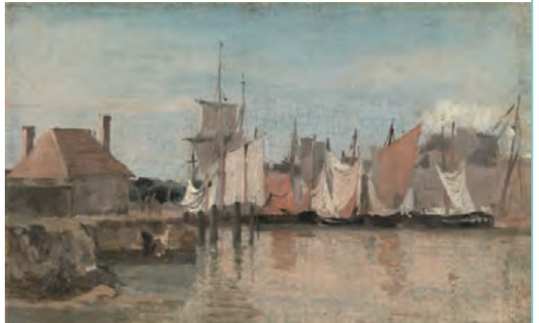
カミーユ・コロー《船舶（ル・アーヴルまたはオンフルール）》 1830-40年頃 油彩・紙、板