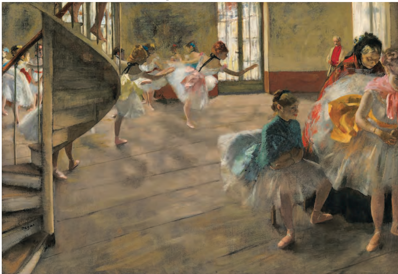
エドガー・ドガ《リハーサル》1874年頃 油彩・カンヴァス