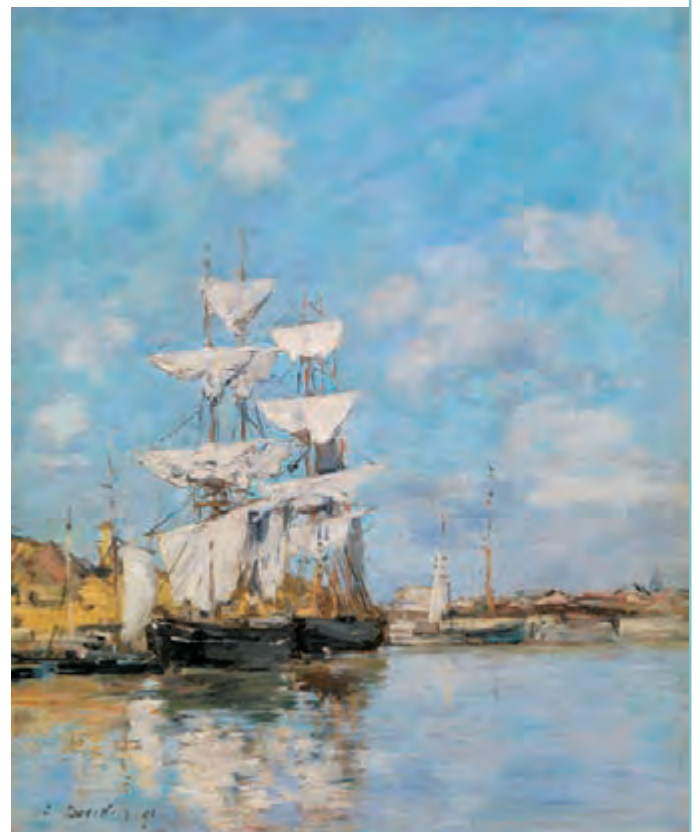
ウジェーヌ・ブーダン 《ドーヴィル、波止場》1891年 油彩・板

バレルは、印象派への道を切り開いたドービニーやブーダンの作品を大いに好んでいました。彼らの作品の多くに海や川が描かれていたからでしょう。グラスゴーの港に、自らの船を幾艘も所有していたバレルは、彼らの作品をどんな思いで眺めていたのでしょうか。