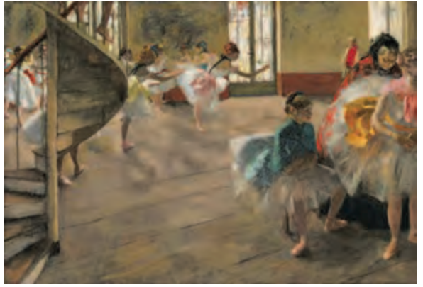
エドガー・ドガ《リハーサル》1874年頃 油彩・カンヴァス ©CSG CIC Glasgow Museums Collection

これまでグラスゴーでしか見るができなかったバレレ・コレクション。本展は同館閉館中だからこそ実現した、またとない機会です。