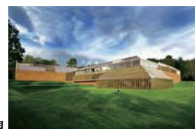
バレル・コレクション外観

少年の頃から美術品に関心を持って収集を始め、1890 年代から 1920 年代にかけて、グラスゴー出身の画商アレクサンダー・リード（1854－1928）から作品を購入。古今東西の美術工芸品を収集しました。1944 年、バレルはコレクションのうち 9000 点以上の作品をグラスゴー市に寄贈。その条件として、当時深刻な社会問題であった大気汚染の影響が少ない郊外にコレクションの作品を展示すること、また英国外には貸し出さないことが提示されました。1983 年にグラスゴー市は郊外のポロック公園内にコレクションを移し、バレル・コレクション（The Burrell Collection）として一般公開。以降、近代名画を集めた世界屈指のコレクションと称され多くの観光客が訪れています。同館は 2015 年から 2020 年まで改修工事により閉館しているため、英国外への作品の貸し出しが可能になり、海を越えて本展の開催が実現しました。