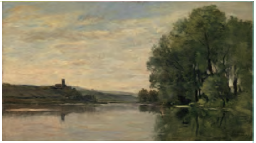
シャルル=フランソワ・ドービニー 《ガイヤール城》 1870-74年頃、油彩・板