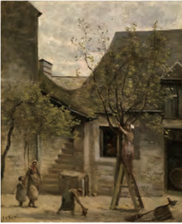
カミーユ・コロロ 《フォンテーヌブローの農家》1865-73年頃 油彩・カンヴァス