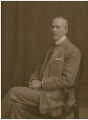
ウィリアム・バレル卿（45歳頃） © CSG CIC Glasgow Museums Collection

その中で最も有名なのがグラスゴー生まれのアレクサンダー・リード（1854-1928）です。1889年にグラスゴーに画廊を開設し、プーダン、ファンタン＝ラトゥール、コロー、クールベ、マネ、ドガ、セザンヌといったフランス人画家のほか、オランダのハーグ派やスコットランドで活動した画家も扱っていました。またパリではフィンセント・ファン・ゴッホの弟で画商だったテオと出会い、仕事を共にする友人でした。本展出品のゴッホが描いたリードの肖像画は、このような関係の中で描かれました。