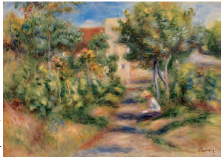
【右下】 ピエール・オーギュスト・ルノワール 《画家の庭》 1903年頃 油彩・カンヴァス ケルヴィングローヴ美術博物館蔵