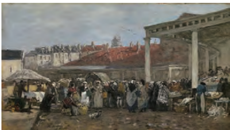
ウジェーヌ・ブーダン《ブリュッセル、旧魚市場》1871年 油彩・板

一方、郊外を描いた作品に目を向けると、バルビゾンやフォンテーヌブローといった、比較的行きやすい近場の田舎が登場します。パリに限らず都市部を活動の拠点としていた画家たちは、美しい自然やそこで生きる農民の姿など、近代化された都市にはない、ノスタルジックな光景を求め郊外へ足を運びました。さらに、こうした絵画を買い求めたのも、都市に住む中産階級以上の人々でした。