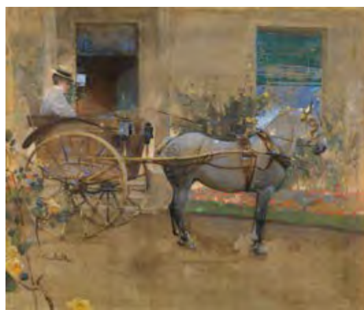
ジョゼフ・クロホルル《二輪馬車》1894-1900年頃 水彩、グワッシュ・麻布