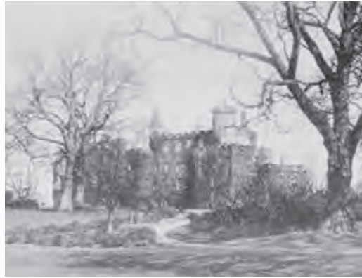
ハットン城（1915年頃）