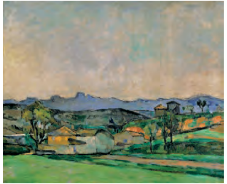
【右上】 ポール・セザンヌ 《エトワール山稜とピロン・デュ・ロワ峰》 1878-79年 油彩・カンヴァス ケルヴィングローヴ美術博物館蔵 © CSG CIC Glasgow Museums Collection