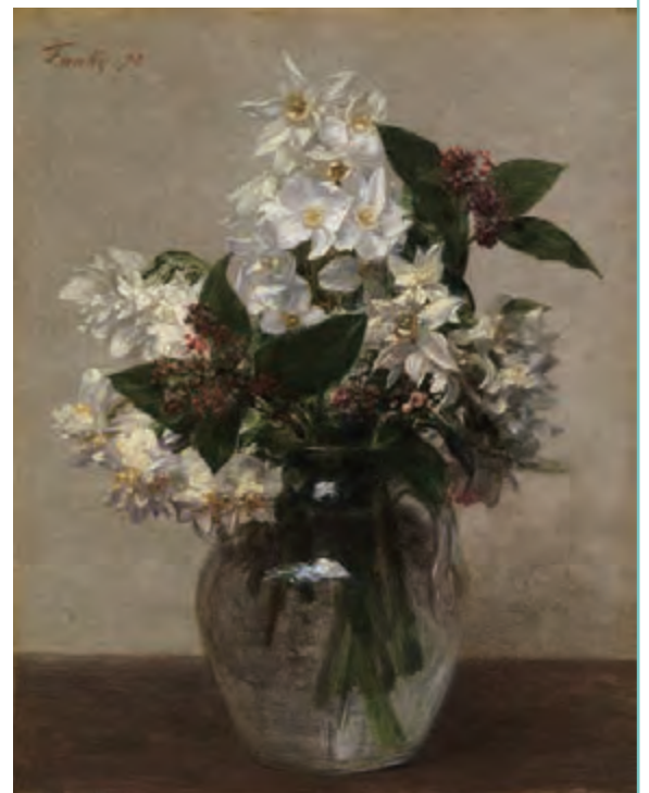
アンリ・ファンタン＝ラトゥール《春の花》1878年 油彩・カンヴァス