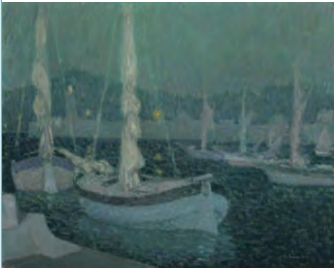
アンリ・ル・シダネル《月明かりの入り江》 1928年 油彩・カンヴァス