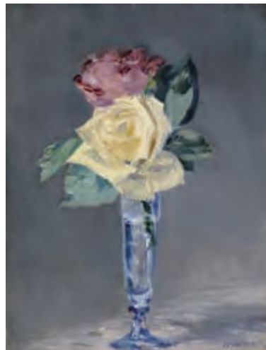
エドゥアール・マネ《シャンパングラスのバラ》 1882年 油彩・カンヴァス