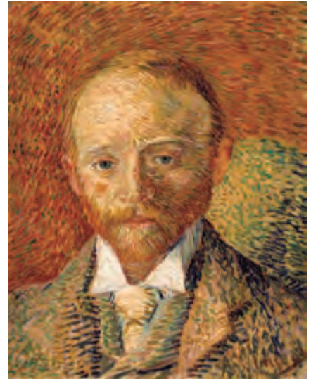
フィンセント・ファン・ゴッホ《アレクサンダー・リードの肖像》1887年 油彩・板 ケルヴィングローヴ美術博物館蔵