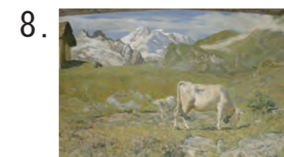
8. ジョヴァンニ・セガンティーニ 《春の牧草地》 1896年 油彩・キャンヴァス ブレラ美術館