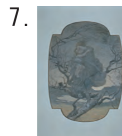
7. ジョヴァンニ・セガンティーニ 《生の天使》 1892年 色鉛筆、パステル、コンテ・紙 セガンティーニ美術館