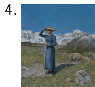
4. ジョヴァンニ・セガンティーニ 《アルプスの真昼》 1891年頃 油彩・キャンヴァス セガンティーニ美術館 (オットー・フィッシュバッハー財団より寄託)