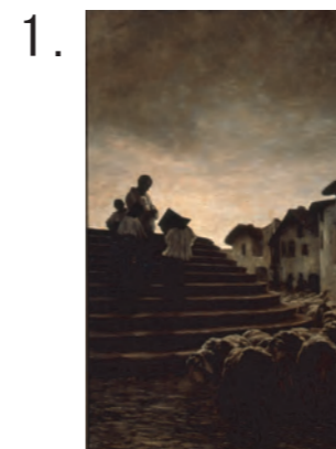
1. ジョヴァンニ・セガンティーニ 《羊たちへの祝福》 1884年頃 油彩・キャンヴァス セガンティーニ美術館