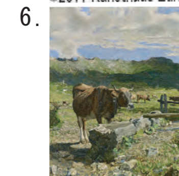
6. ジョヴァンニ・セガンティーニ 《水を飲む茶色い雌牛》 1892年 油彩・キャンヴァス セガンティーニ美術館 (オットー・フィッシュバッハー財団より寄託)