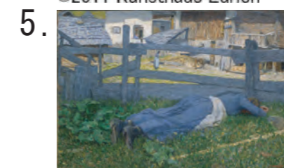
5. ジョヴァンニ・セガンティーニ 《日陰の憩い》 1892年 油彩・キャンヴァス クリストフ・プロヒャー・コレクション