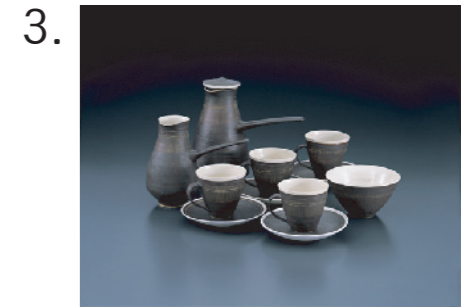
3. ハンス・コパー/ルーシー・リー 《コーヒーセット(7点組)》 1955年頃 滋賀県立陶芸の森 陶芸館蔵