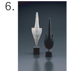
6. ハンス・コパー 《キラデス・フォーム》 左/1975年 パークレイ・コレクション 右/1975年頃 個人蔵