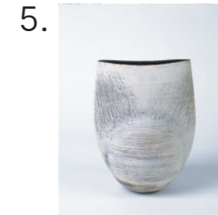
5. ハンス・コパー 《ポット》 1960年代後半 兵庫陶芸美術館蔵