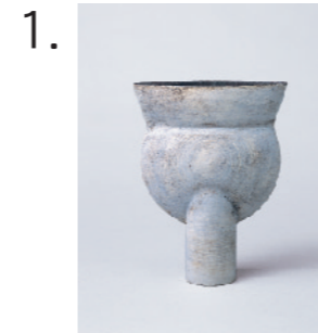
1. ハンス・コパー 《ティッソル・フォーム》 1970年代前半 兵庫陶芸美術館蔵