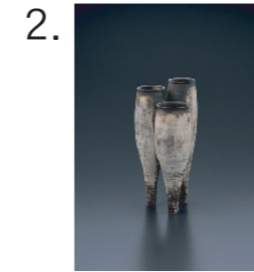
2. ハンス・コパー 《トライポット》 1956年 個人蔵