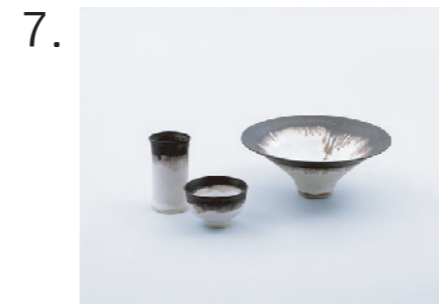
7. ルーシー・リー 左から《シリンダー》1977年 《ボウル》1976年 《ボウル》1977年 すべてパークレイ・コレクション