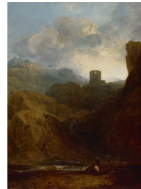
ジョゼフ・マラド・ウィリアム・ターナー 《ドルバダーン城》1800年 油彩・カンヴァス ロイヤル・アカデミー・オブ・アーツ