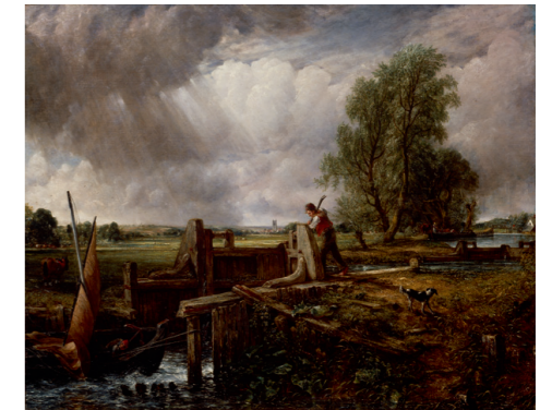
ジョン・カンスタブル 《水門を通る舟》1826年 油彩・カンヴァス ロイヤル・アカデミー・オブ・アーツ