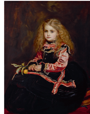
ジョン・エヴァレット・ミレイ 《ベラスケスの思い出》1868年 油彩・カンヴァス ロイヤル・アカデミー・オブ・アーツ