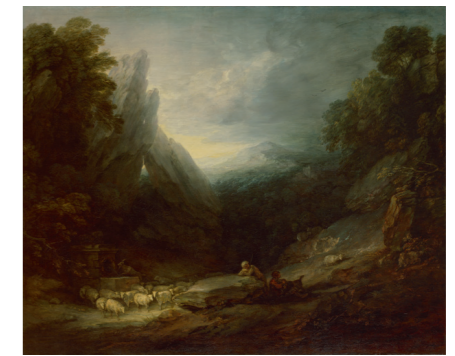
トマス・ゲインズバラ 《泉に羊のいるロマンティックな風景》1783年頃 油彩・カンヴァス ロイヤル・アカデミー・オブ・アーツ