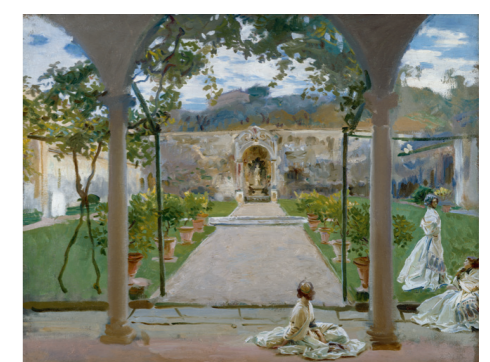
ジョン・シンガー・サージェント 《庭の女性たち、トッレガッリ城》1910年 油彩・カンヴァス ロイヤル・アカデミー・オブ・アーツ