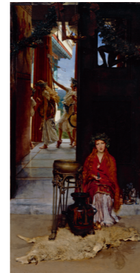
ローレンス・アルマ=タデマ 《神殿への道》1882年 油彩・カンヴァス ロイヤル・アカデミー・オブ・アーツ