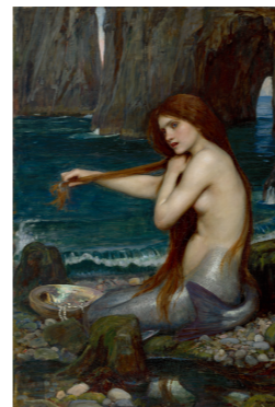
ジョン・ウィリアム・ウォーターハウス 《人魚》1900年 油彩・カンヴァス ロイヤル・アカデミー・オブ・アーツ